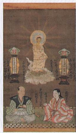
長尾政景夫妻像 (常慶院・米沢市) 前期