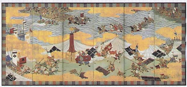
川中島合戦図屏風(長野県立歴史館・千曲市) 前期