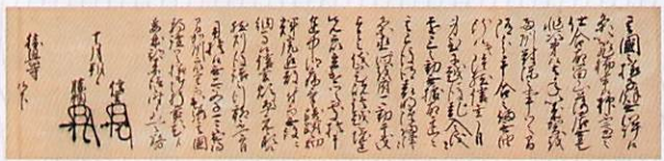
【富山県指定文化財「勝興寺文書」】 (元亀3年・1572)10月1日 勝興寺宛武田信玄・勝頼連署状 (勝興寺・高岡市) 後期