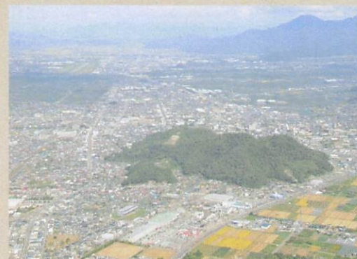
天童古城

しだれざくらきりもんまきえふばこ ◀ 枝垂桜桐紋蒔絵文箱 金蒔絵や天童家の家紋である五七桐紋などがある豪華な文箱です。江戸時代前期頃の作とされ、準一家という天童家の家格を象徴するような資料です。