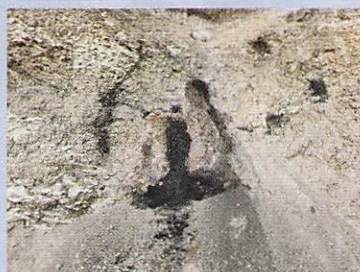
原油のしみ出し (黒川油田)