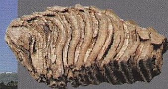
ナウマンゾウの歯

第四紀は現生につながる時代です。火山や温泉、現在の地形の大部分はこの時代に造られました。