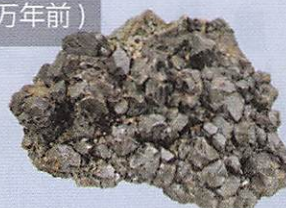
閃亜鉛鉱巨晶群品