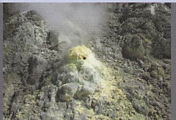
玉川温泉の噴気孔