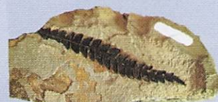
ナウマンヤマモモ

この時代の地層は秋田県に広く分布しています。その多くは日本海ができ始めてから今の日本列島になるまでの時期に形成され、黒鉱や石油など多くの地下資源が生み出されました。また、堆積岩層からは多くの化石が見つかり、当時の環境が復元されています。