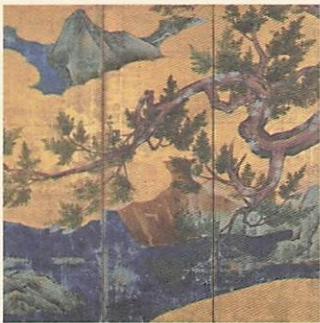
国宝『楡図屏風』高精細複製品★ 原本：狩野永徳 筆 | 東京国立博物館所蔵