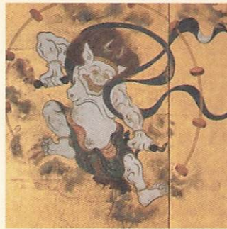
国宝『風神雷神図屏風』高精細複製品 原本：依屋宗達 筆 | 大本山 建仁寺所蔵