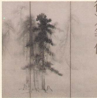
国宝『松林図屏風』高精細複製品 原本：長谷川等伯 筆 | 東京国立博物館所蔵