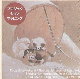
『十二ヶ月花鳥図』高精細複製品 原本：葛飾北斎 筆 | スミソニアン国立アジア美術館所蔵

菱川師宣の作品は、『江戸風俗図屏風』(原本:スミソニアン国立アジア美術館所蔵)の高精細複製品も展示します。