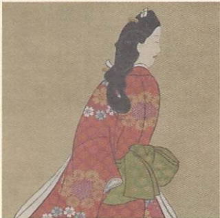
『見返り美人図』高精細複製品★ 原本：菱川師宣 筆 | 東京国立博物館所蔵